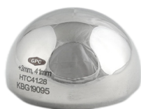
Prótesis Cadera Bipolar