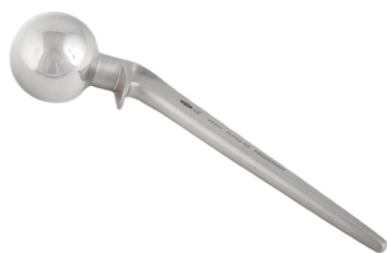
Prótesis Cadera Lazcano