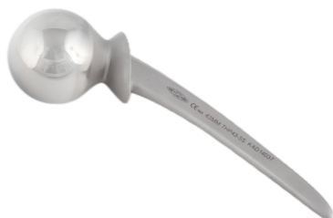
Prótesis Cadera Thompson